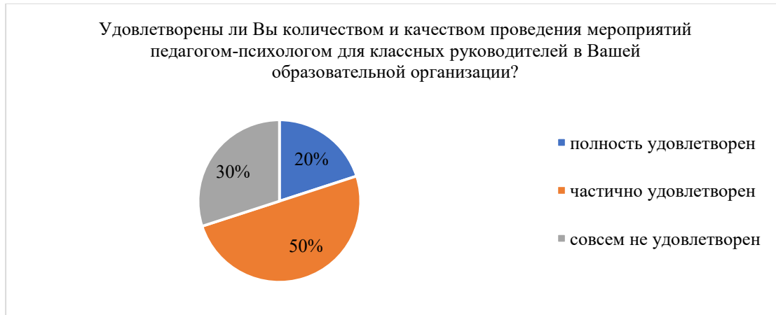
Рисунок 2 – Удовлетворенность классных руководителей качеством взаимодействия с педагогом-психологом

Проанализировав ответы респондентов, мы пришли к определенным выводам. Качеством проведения педагогом-психологом мероприятий в рамках осуществления взаимодействия с классными руководителями полностью удовлетворены лишь 20% опрошенных, частично удовлетворены – 50%, а совсем не удовлетворены- 30%, что говорит о том, что педагогам-психологам гимназии необходимо пересмотреть свой формат взаимодействия с данной категорией педагогов (см. рисунок 2).