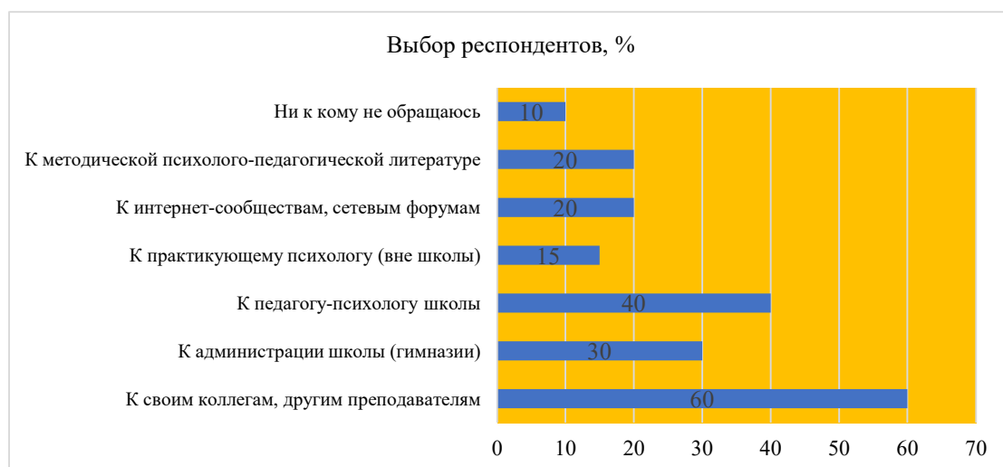
Рисунок 3 – Характер обращения классных руководителей за помощью при возникновении психолого-педагогических трудностей в работе

Почти все респонденты (за исключением 10%) обращаются за помощью, сталкиваясь на своем профессиональном пути с трудностями (см. рисунок 3).