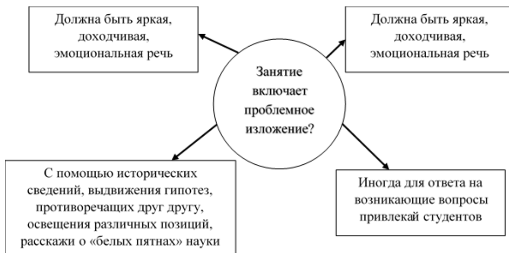
Рисунок 1 – Методы вовлечения внимания студентов на занятии, включающее проблемное изложение

Уже давно не принято считать [1], что обучение в ВУЗе, это не рутинная из сухих лекций или практик, на которых решаются однотипные задачи. Разговоры о внедрении инновационных технологий в обучение из перспектив будущего превратилось в реалии. Одним из принципов, позволяющих рассматривать методику обучения как инновационную, является адаптация уже существующей эффективной методики под конкретные педагогические условия [2]. Ярким примером может служить методика проблемного изложения, созданная американским психологом, философом и педагогом Дж. Дьюи в начале XX века. Эта методика обладает самой малой степенью самостоятельной поисковой деятельности студентов, поскольку, лично преподаватель указывает проблемы, задавая большое число вопросов, сам же лично на них отвечает, ведёт диалог с самим собой. Однако таким способом, преподаватель показывает логику эволюции развития какого-либо понятия или факта, теории, то есть как же шел процесс открытия. Чем занятнее рассказ-объяснение преподавателя, тем больше студентов втягивается в дух поиска решения, они, активизируя свое мышление, становятся уже соучастниками открытий, проникая во всё более сложные факты и видя их взаимосвязи, тем самым повышается интерес к предмету (рис. 1) [3].